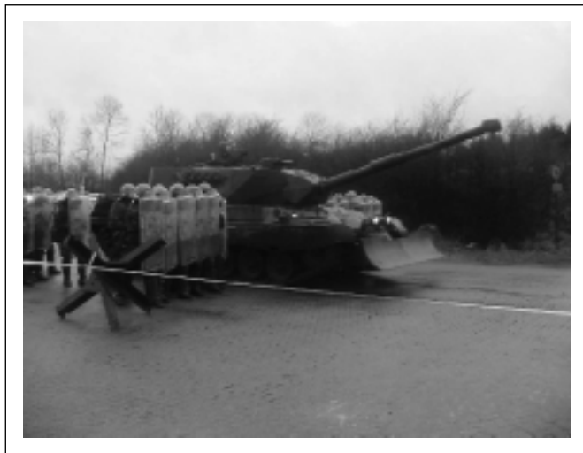
Kampvogn Leopard rykker frem og rydder vejspærring.