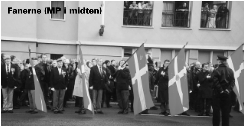
Fanerne (MP i midten)