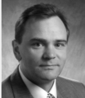
Forsvarsminister Jan Trøjborg

Sender du - holdkammerat - en hilsen? Det gør jeg!