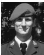
V. Svendsen Flidspræmie. 7 MPDEL

Efter den traditionelle morgenappell havde de pårørende mulighed for at se nogle af de ting, de kommende militærpolitisergenter havde lavet de forgangne 8 måneder. Yngste elevhold havde nemlig sat forskellige stande op, så man kunne se resultatet af uddannelsen i boksning, selvforvar, militærpolitistationstjeneste og våbenbrug.